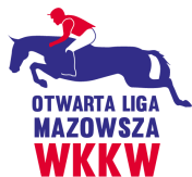
TABELA RANKINGOWA – 2016 OTWARTEJ LIGI MAZOWSZA W WKKW PO II ELIMINACJI Rozegranej 11-12.06.2016 r. w SO Bogusławice w Bogusławicach